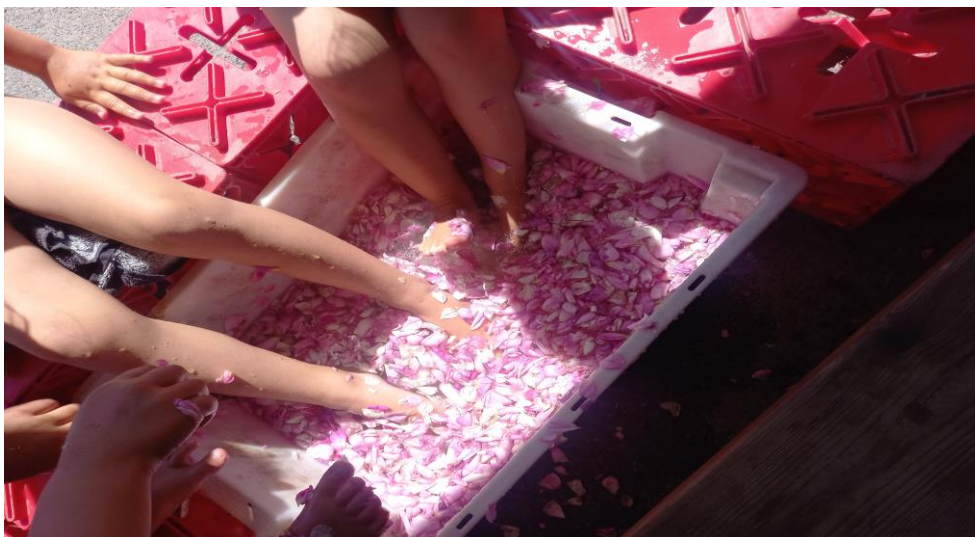
Et duftende fotbad er godt for sansene og en god sommertradisjon på Havhesten!

Reggio Emilia- filosofien står for en pedagogisk arbeidsmåte og et allsidig menneske og kunnskapssyn som har sin forankring i en humanistisk livsholdning. Med en dyp respekt for barnet og en overbevisning om at alle barn fødes rike og intelligente og en sterk tro på menneskets muligheter. Å se barnet som et subjekt avspeiler nettopp det menneskesyn vi til stadighet jobber for skal prege al vår samhandling med barn og voksne. Den grunnleggende filosofien her er, at barna lærer gjennom bla å konstruere sin egen kunnskap i samhandling med andre barn, omgivelsene sine og kompetente nysgjerrige voksne. Dette skjer ved at alle sansene, fornuften, fantasien og kreativiteten oppøves ved stadig stimulering. Når man tar i «materialet» oppnås en helt egen kunnskap, derav de kloke ord under. Ordet kopp, ball eller snø får f.eks. en helt annen betydning og det oppnås en helt forståelse når man kan ta på koppen/ballen/snøen og sanse den.